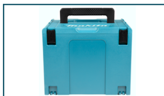
Mbox nr.4 (1 stuks) - 821552-6 - 0088381433006