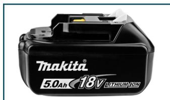
Accu BL1850B LXT 18V 5,0Ah (1 stuks) - 830-8 - 0088381459129