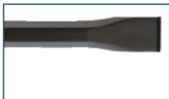
Koudbeitel 20x250 mm SDS-PLUS (1 stuks) - 0088381179539