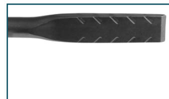
Koudbeitel premium 20x250mm SDS-PLUS (1 stuks) - 0088381534451

Dit is slechts een kleine greep uit het ruime assortiment. Kijk voor alle accessoires/verbruiksartikelen in de Catalogus of op www.makita.nl .