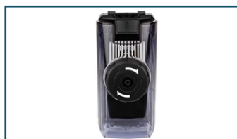
Stofbox voor DX05 (1 stuks) - 199595-9 - 0088381541480