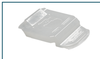
Beschermkap Li-ion batterij (1 stuks) - 450128-8 - 0088381343183