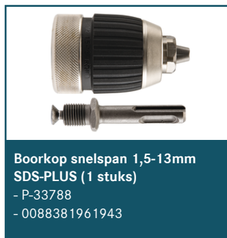
Boorkop snelspan 1,5-13mm SDS-PLUS (1 stuks) - P-33788 - 0088381961943