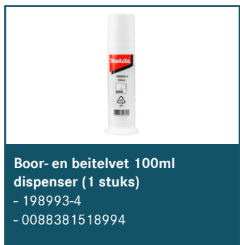
Boor- en beitelvet 100ml dispenser (1 stuks) - 198993-4 - 0088381518994