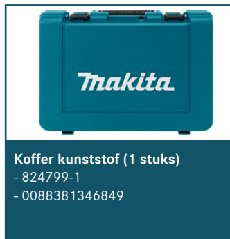
Koffer kunststof (1 stuks) - 824799-1 - 0088381346849