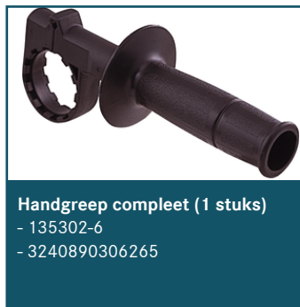
Handgreep compleet (1 stuks) - 135302-6 - 3240890306265