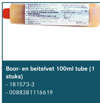
Boor- en beitelvet 100ml tube (1 stuks) - 181573-3 - 0088381116619