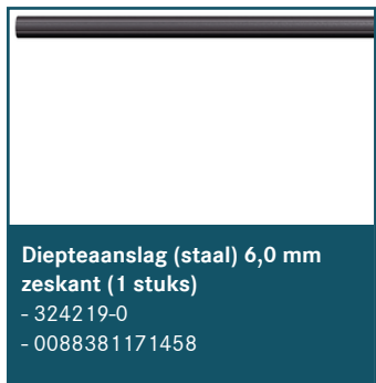
Diepteanslag (staal) 6,0 mm zeskant (1 stuks) - 324219-0 - 0088381171458