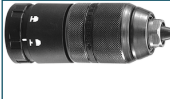
Boorkop snelspan 1,5-13mm (1 stuks) - 194079-2 - 0088381196826