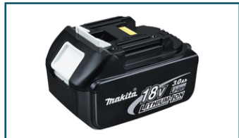
Accu BL1830 LXT 18V 3,0Ah (1 stuks) - 193533-3 - 0088381367004