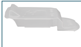
Afdekkap LXT 14,4V/18V accu's (1 stuks) - 450128-8 - 0088381343183