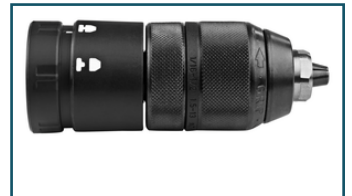
Boorkop snelspan 1,5-13mm (1 stuks) - 199139-5 - 0088381525695

Dit is slechts een kleine greep uit het ruime assortiment. Kijk voor alle accessoires/verbruiksartikelen in de Catalogus of op www.makita.nl .