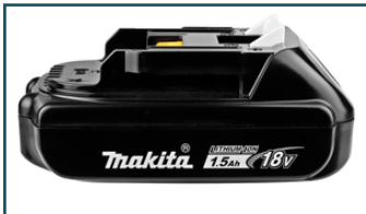
Accu BL1815N LXT 18V 1,5Ah (1 stuks) - 196235-0 - 0088381417556