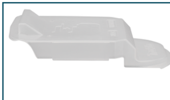
Afdekkap LXT 14,4V/18V accu's (1 stuks) - 450128-8 - 0088381343183