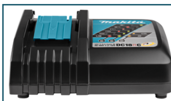
Oplader LXT DC18RC (1 stuks) - 195584-2 - 0088381373562

Dit is slechts een kleine greep uit het ruime assortiment. Kijk voor alle accessoires/verbruiksartikelen in de Catalogus of op www.makita.nl .