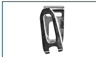
Draaghaak lang (1 stuks) - 346317-0 - 3240890353641