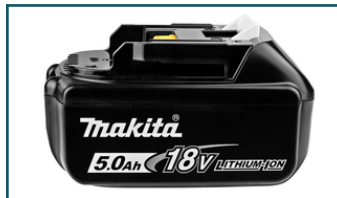
Accu BL1850B LXT 18V 5,0Ah (2 stuks) - 197280-8 - 0088381459129