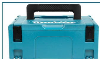
Mbox nr.2 (1 stuks) - 821550-0 - 0088381430128