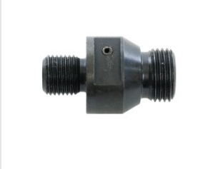
Artikel code 620054 ADAPTER 1 / 2" (UITW.) > M16 DROOGBOORSYSTEEM