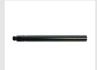
Artikel code 622010 VERLENGSTUK 1 / 2" DIAMANTBOREN - 200 MM