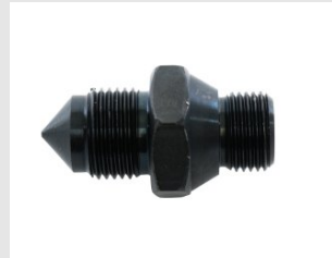
Artikel code 654950 ADAPTER 1 / 2" (UITW.) >M20 X 1.5 - SDD-SYSTEEM