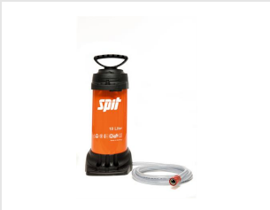
Artikel code 172710 SPIT WATERPOMP 10L