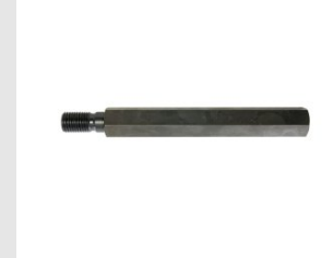
Artikel code 622050 VERLENGSTUK 1 1 / 4" 200 MM