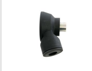
Artikel code 620052 STOFAFZUIGINGSADAPTER M16