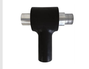
Artikel code 654720 HYBRID AIRFLOW AFZUIGADAPTER 1 1 / 4" > M41