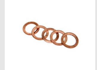
Artikel code 172770 KOPEREN RINGEN (5 STUKS)