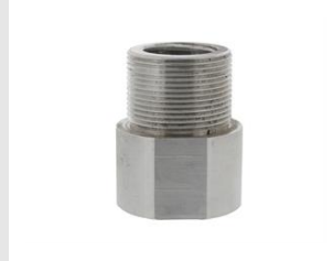
Artikel code 654721 HYBRID ADAPTER NATBOREN 1 1 / 4" > M41