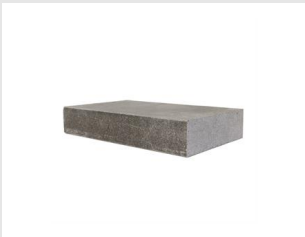
Artikel code 622200 SCHERPSTEEN VOOR DIAMANT