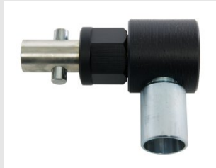
Artikel code 654900 STOFAFZUIGINGSADAPTER - SDD