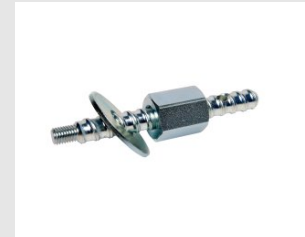
Artikel code 622220 GRIP M12 SNELSPAN BEVESTIGINGSKIT