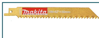
Reciprozaagb 130 HM S64 1HM (1 stuks) - P-05044 - 0088381914192