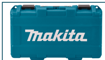
Koffer (1 stuks) - 821620-5 - 3240890454263