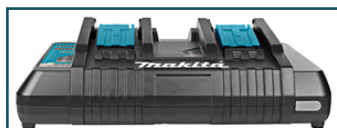
Oplader LXT DC18RD (1 stuks) - 196933-6 - 0088381444033