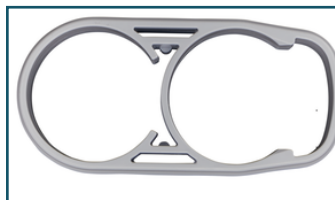
Zuigbuis houder wit (1 stuks)