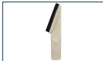
Borstelzuigmond ivoor wit (1 stuks)