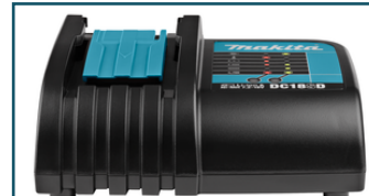
Oplader LXT DC18SD (1 stuks)