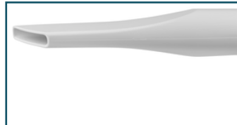
Kierzuigmond kort wit (1 stuks)