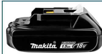
Accu BL1815N LXT 18V 1,5Ah (1 stuks)