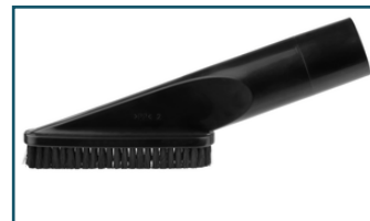
Borstelzuigmond zwart (1 stuks)