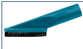
Borstelzuigmond blauw (1 stuks)