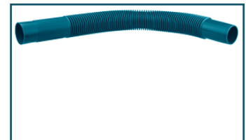
Flexibele zuigbuis blauw (1 stuks)