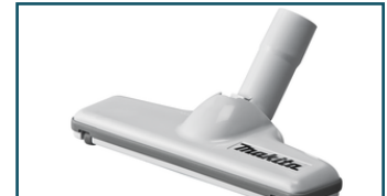
Vloerzuigmond harde vloer wit (1 stuks)