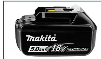
Accu BL1850B LXT 18 V 5,0Ah (1 stuks)