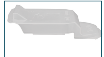
Afdekkap LXT 14,4V/18V accu's (1 stuks)