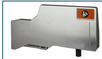
Aanslag boven rechts (1 stuks)