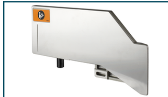
Aanslag boven links (1 stuks)