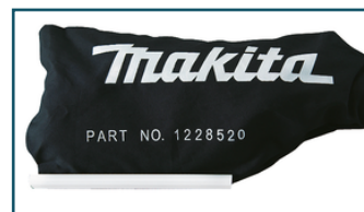
Linnen stofzak radiaal afkortzaag (1 stuks)