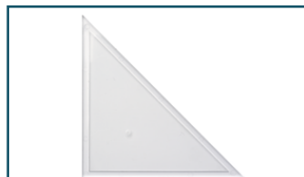
Afstelhoek (1 stuks)