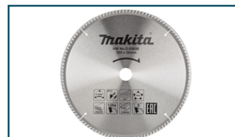
Afkortzaagblad div. materialen (1 stuks)