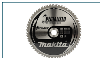
Afkortzaagblad Hout (1 stuks)