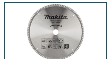
Afkortzaagblad div. materialen (1 stuks)