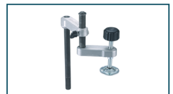
Materiaalklem verticaal (1 stuks)