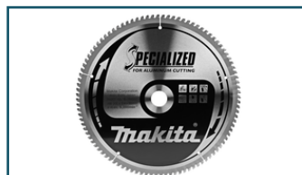
Afkortzaagblad Aluminium (1 stuks)