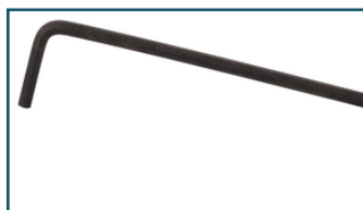
Inbussleutel 2,5 mm (1 stuks)