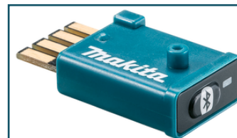
AWS zender WUT01 (1 stuks)