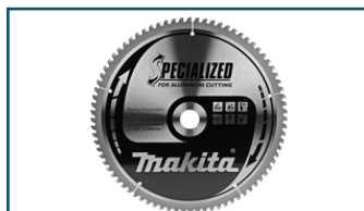
Afkortzaagblad Aluminium (1 stuks)