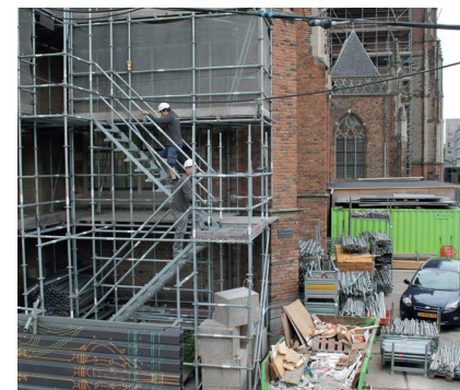
De restauratie van de Eusebiuskerk is een langlopend project dat wordt uitgevoerd door bouwbedrijf Nico de Bont.

"Wij nemen blokken steen weg en zetten er nieuwe blokken in", vertelt Weijters. "Het voegwerk wordt verwijderd en natuurstenen onderdelen worden weer teruggeplaatst. Stofvrij werken vind ik daarbij heel belangrijk voor de werknemers, het milieu en de omgeving." Volgens Weijters voldoet een goede stofkap aan vier eisen: "Hij moet functioneel zijn, makkelijk bedienbaar, makkelijk aan te sluiten en niet te zwaar." 📌