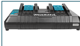
Oplader LXT DC18RD (1 stuks) - 196933-6 - 0088381444033