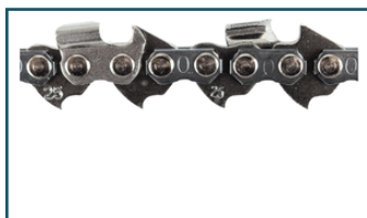
Ketting 092 "rnd" 3/8x1,3 S52 (1 stuks) - 958492652 - 4002829806975