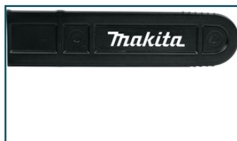
Transportbescherming 45cm (1 stuks) - 419560-5 - 3240890367563