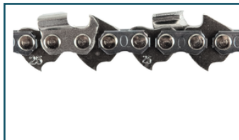
Ketting 092 "rnd" 3/8x1,3 S56 (1 stuks) - 958492656 - 4002829807217