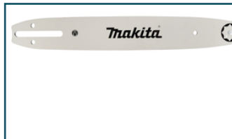
Zwaard "gelaagd" 40x1,3x3/8" (1 stuks) - 958040661 - 4002829491591