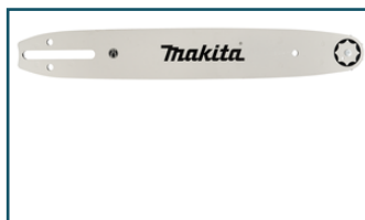
Zwaard "gelaagd" 35x1,3x3/8" (1 stuks) - 958035661 - 4002829491577

Dit is slechts een kleine greep uit het ruime assortiment. Kijk voor alle accessoires/verbruiksartikelen in de Catalogus of op www.makita.nl .