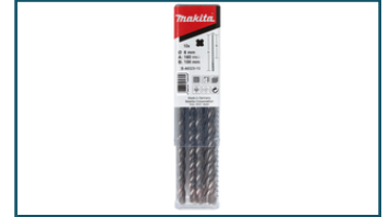
P2S SDS-PLUS boor 6x160mm 10st (1 stuks) - B-46523-10 - 0088381456456

Dit is slechts een kleine greep uit het ruime assortiment. Kijk voor alle accessoires/verbruiksartikelen in de Catalogus of op www.makita.nl .