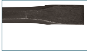
Koudbeitel 20x250 mm SDS-PLUS (1 stuks) - D-08729 - 0088381179539