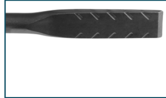
Koudbeitel premium 20x250mm SDS-PLUS (1 stuks) - B-64244 - 0088381534451