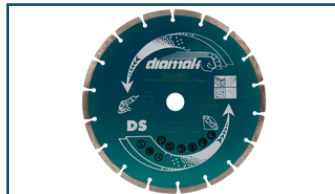
Diamantschijf 230x22,23x2,4mm (1 stuks) - D-61145 - 0088381475792