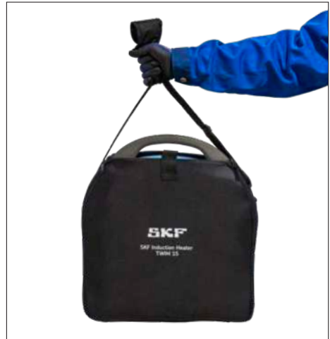
Fig. 3 & 4 – Sacoche de transport et de rangement du TWIM 15