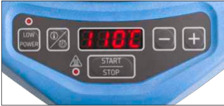
Fig. 2 – Brugergrenseflade