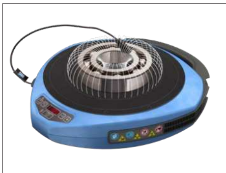
Fig. 1 – Magnetfelt omkring leje

Den bærbare induktionsvarmer TWIM 15 består af en glasfyldt polymertopplade, der modstår høje temperaturer og har elektromagnetiske spoler under sig. Når der tændes for varmeren, løber der strøm gennem spolerne, og det genererer et vekslende magnetfelt, men ingen varme på selve toppladen. Men hvis du placerer en komponent af jern eller rustfrit stål ovenpå, inducerer magnetfeltet mange mindre elektriske strømme (hvirvelstrømme) i komponenternes metal.