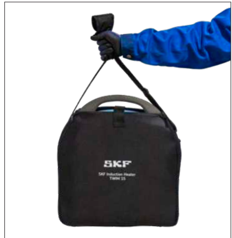
Abb. 3 und 4 – Transport- und Aufbewahrungsbeutel für TWIM 15