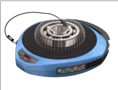
Fig. 1 – Campo magnético ao redor do rolamento

O aquecedor por indução portátil TWIM 15 consiste em uma placa de polímero reforçado com fibra de vidro, resistente a altas temperaturas, e bobinas eletromagnéticas, situadas abaixo da placa. Quando o aquecedor está ligado, uma corrente elétrica passa pelas bobinas e gera um campo magnético oscilante, que não aquece a placa superior em si. Porém, assim que um componente de ferro ou aço inoxidável é colocado sobre a placa, o campo magnético induz muitas correntes elétricas pequenas (correntes parasitas) no metal dos componentes.