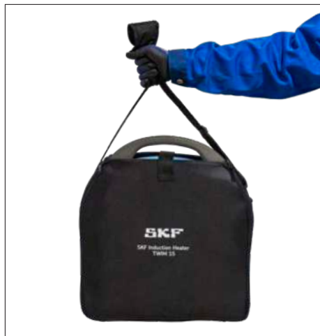
Рис. 3 и 4 – Сумка для транспортировки и хранения TWIM 15