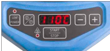
Fig. 2 – Interfaccia utente