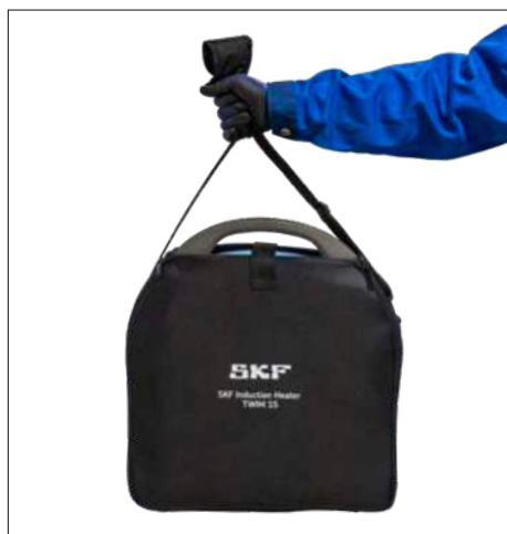
Fig. 3 e 4 – Bolsa de transporte e armazenamento do TWIM 15