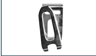
Draaghaak lang (1 stuks)