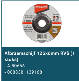
Afbraamschijf 125x6mm RVS (1 stuks) - A-80656 - 0088381139168