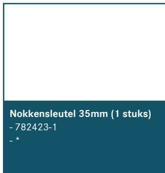
Nokkensleutel 35mm (1 stuks) - 782423-1 - *