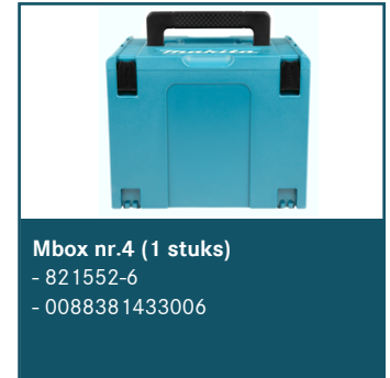
Mbox nr.4 (1 stuks) - 821552-6 - 0088381433006