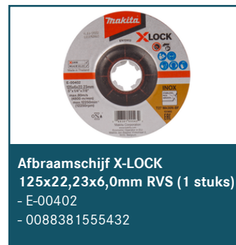
Afbraamschijf X-LOCK 125x22,23x6,0mm RVS (1 stuks) - E-00402 - 0088381555432