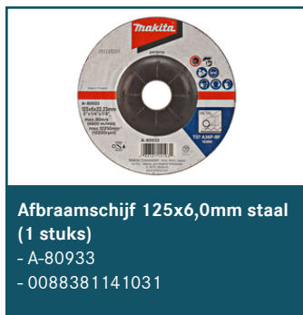
Afbraamschijf 125x6,0mm staal (1 stuks) - A-80933 - 0088381141031