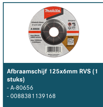
Afbraamschijf 125x6mm RVS (1 stuks) - A-80656 - 0088381139168