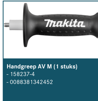
Handgreep AV M (1 stuks) - 158237-4 - 0088381342452