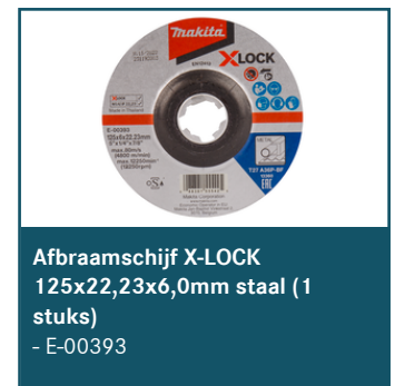
Afbraamschijf X-LOCK 125x22,23x6,0mm staal (1 stuks) - E-00393

Dit is slechts een kleine greep uit het ruime assortiment. Kijk voor alle accessoires/verbruiksartikelen in de Catalogus of op www.makita.nl .