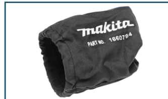
Linnen stofzak handpalm vlak- en excenterschuurmachine (1 stuks) - 166078-4