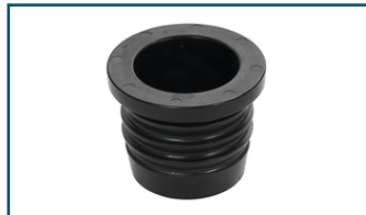
Koppeladapter ribbedx22mm (1 stuks) - 417408-5 - 0088381157872