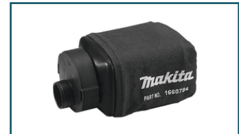
Linnen stofzak handpalm vlak- en excenterschuurmachine (1 stuks) - 135222-4

Dit is slechts een kleine greep uit het ruime assortiment. Kijk voor alle accessoires/verbruiksartikelen in de Catalogus of op www.makita.nl .