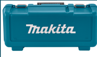
Koffer (1 stuks) - 824806-0 - 0088381346092