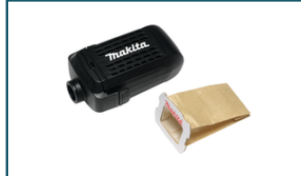
Stofbox met papieren stofzak (1 stuks) - 135246-0 - 0088381403528