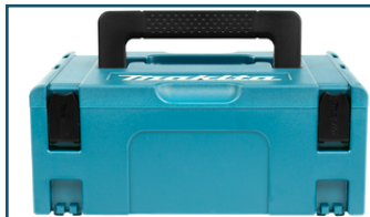
Mbox nr.2 (1 stuks) - 821550-0 - 0088381430128