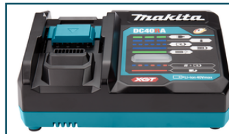
Oplader XGT DC40RA (1 stuks) - 191E07-8 - 0088381556354