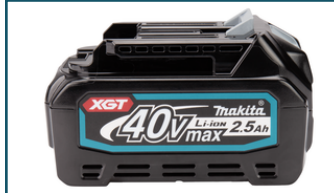
Accu BL4025 XGT 40 V Max 2,5Ah (1 stuks) - 191B36-3 - 0088381556521