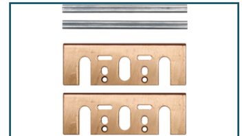
HM wisselbeitelset 82mm (1 stuks) - D-07951 - 0088381181617

Dit is slechts een kleine greep uit het ruime assortiment. Kijk voor alle accessoires/verbruiksartikelen in de Catalogus of op www.makita.nl .