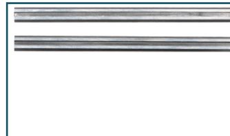
HM wisselbeitels 82mm (1 stuks) - D-07945 - 0088381181600