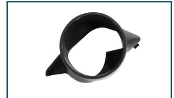
Stofafzuigadapter schaaf (1 stuks) - 451329-1 - 0088381361422