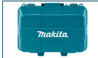
Koffer (1 stuks) - 824892-1 - 0088381361408