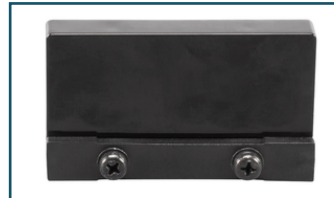
Schaafbeitel afstelmal (1 stuks) - 123062-2 - 0088381111270