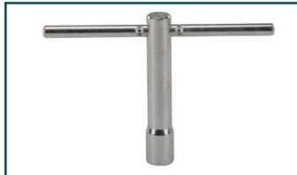
Dopsleutel 9mm (1 stuks) - 782209-3 - 0088381102568