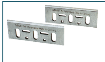
HM schaaftbeitels 82mm (1 stuks) - D-07967 - 0088381181624