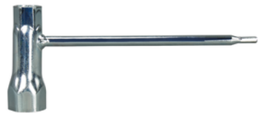
782037-6 Dopsleutel 13-19mm