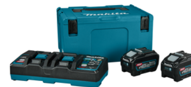
191U13-9 Startset XGT DC40RB / 2x BL4050F