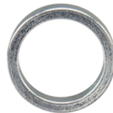
191W53-9 Reduceerring 25,4x20x5mm