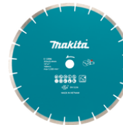
E-12996 Diamantschijf 355x2,8x25,4mm