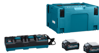
191U00-8 Startset XGT DC40RB / 2x BL4040