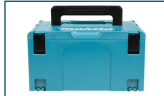
Mbox nr.3 (1 stuks)