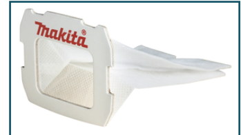
Polyester stofzak voor stofbox (1 stuks)