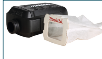
Stofbox met polyester stofzak (1 stuks)