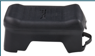
Beschermkap (1 stuks)