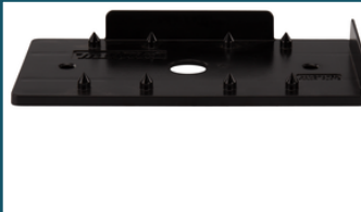
Perforatieplaat vlagschuurmachine (1 stuks)