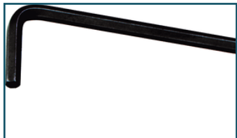
Inbussleutel 5,0 mm (1 stuks)