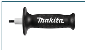
Handgreep 36mm (1 stuks)