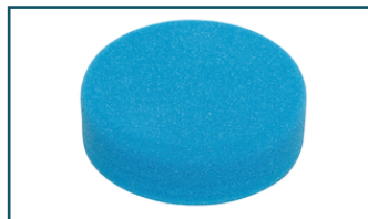
Spons blauw 150 mm (1 stuks)