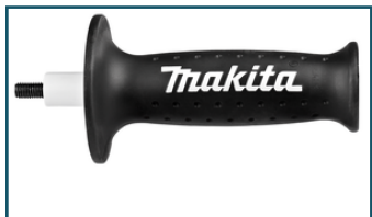
Handgreep (1 stuks)