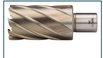
Kernboor HSS 16x50 mm (1 stuks) - HB16L - 8720023043731

Dit is slechts een kleine greep uit het ruime assortiment. Kijk voor alle accessoires/verbruiksartikelen in de Catalogus of op www.makita.nl .