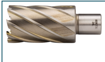
Kernboor HSS 14x30 mm (1 stuks) - HB14S - 8720023043540