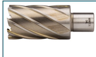
Kernboor HSS 16x30 mm (1 stuks) - HB16S - 8720023043557