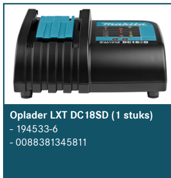
Oplader LXT DC18SD (1 stuks) - 194533-6 - 0088381345811