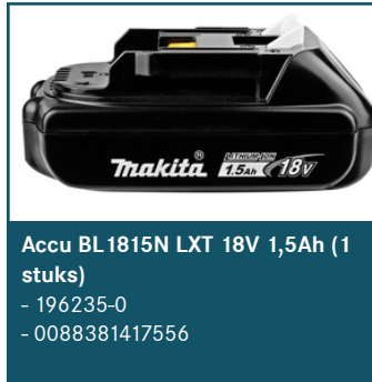
Accu BL1815N LXT 18V 1,5Ah (1 stuks) - 196235-0 - 0088381417556