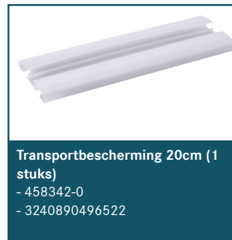
Transportbescherming 20cm (1 stuks) - 458342-0 - 3240890496522