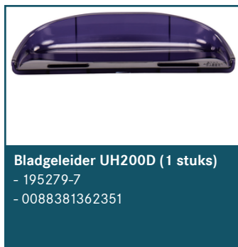
Bladgeleider UH200D (1 stuks) - 195279-7 - 0088381362351