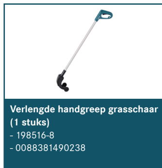
Verlengde handgreep grasschaar (1 stuks) - 198516-8 - 0088381490238

Dit is slechts een kleine greep uit het ruime assortiment. Kijk voor alle accessoires/verbruiksartikelen in de Catalogus of op www.makita.nl .