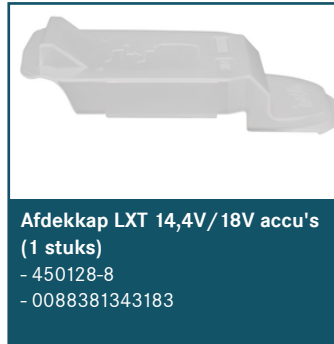
Afdekkap LXT 14,4V/18V accu's (1 stuks) - 450128-8 - 0088381343183