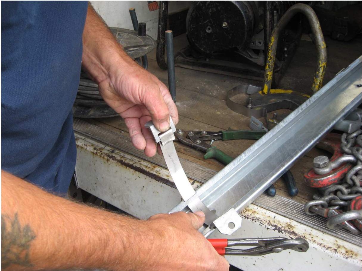
Stap 10 Bevestig nu de andere 2 hoekijzers op dezelfde wijze