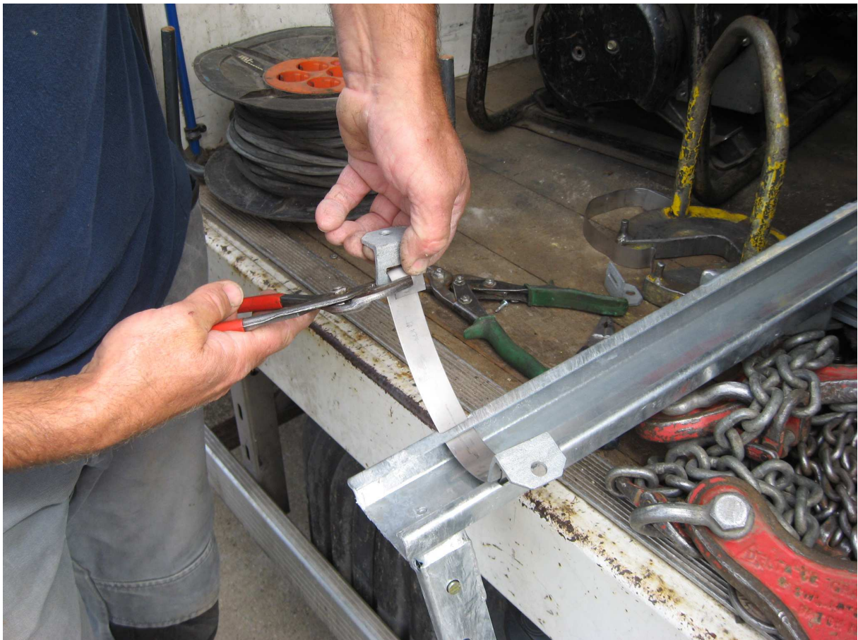
Stap 9 Bevestig nu de andere 2 hoekijzers op dezelfde wijze