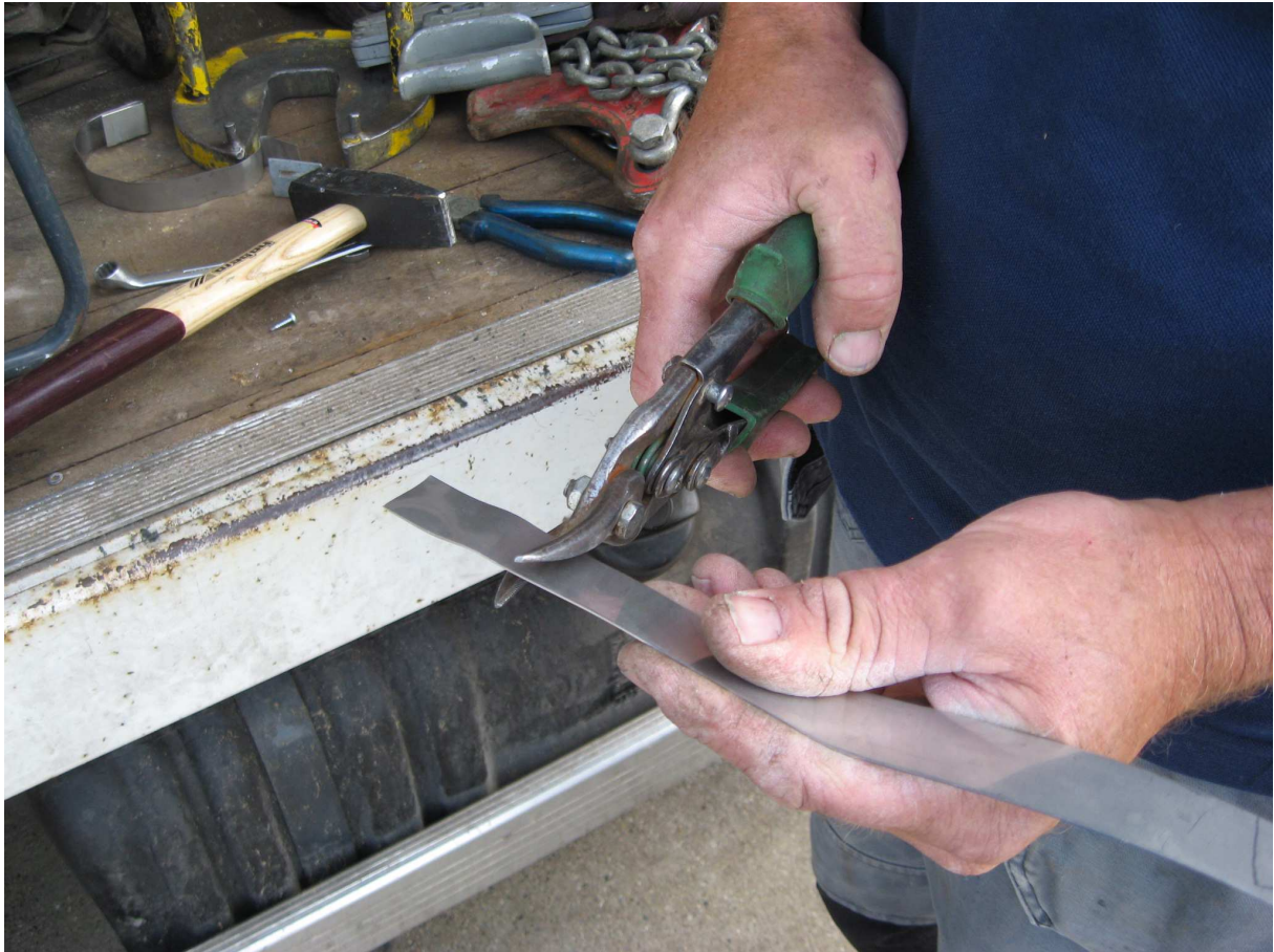
Stap 3 Zaag of knip de trekband af op de afgetekende lengte