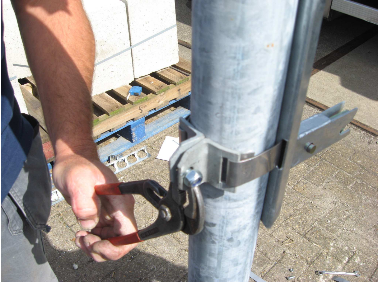
Stap 12 Vouw de trekband om de paal en bevestig de 2 hoekijzers aan elkaar met het boutje en moertje