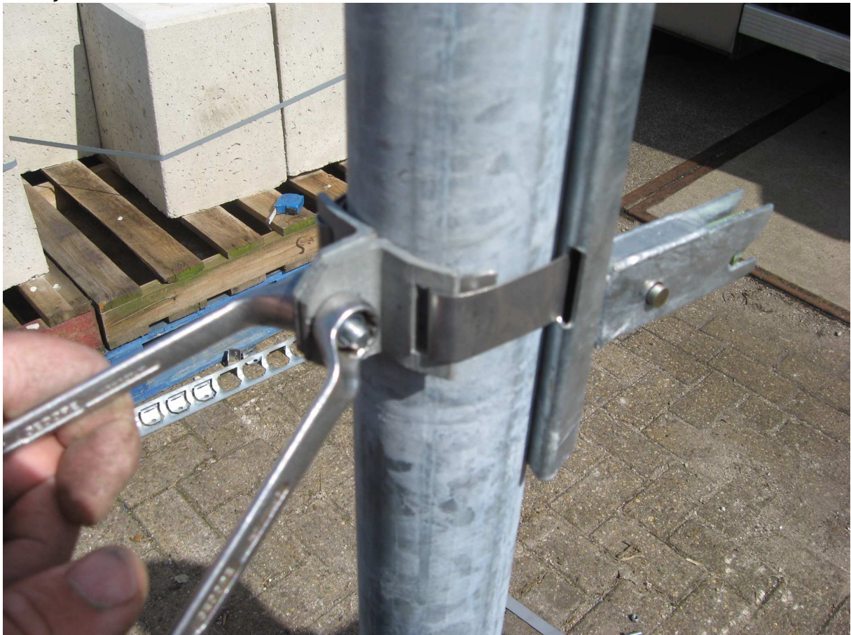
Stap 13 Draai de bout aan totdat de paalbevestiging strak en stevig tegen de paal steunt