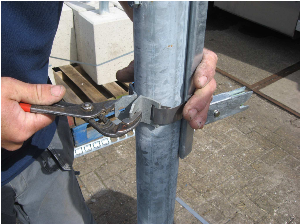
Stap 11 Vouw de trekband om de paal en bevestig de 2 hoekijzers aan elkaar met het bout, ring en moer.