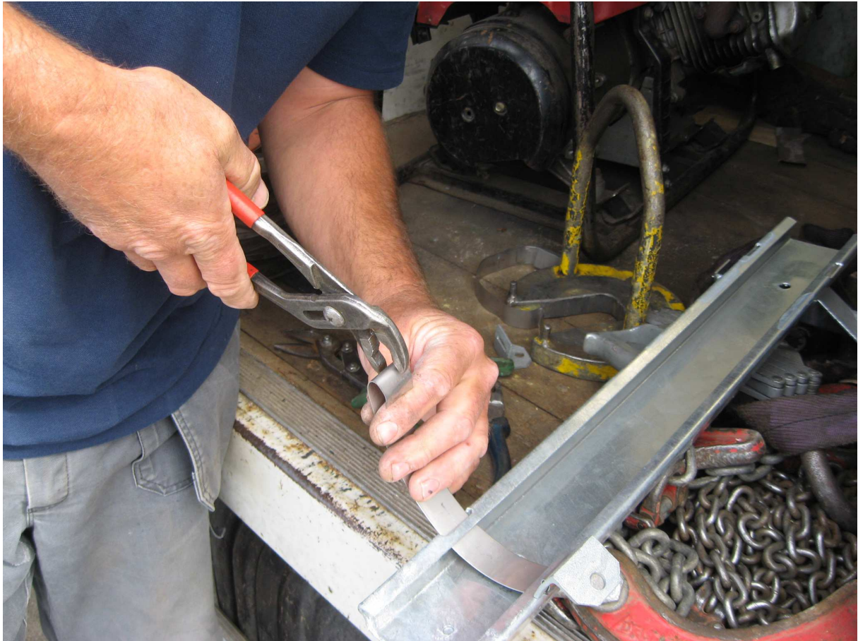
Stap 8 Bevestig nu de andere 2 hoekijzers op dezelfde wijze