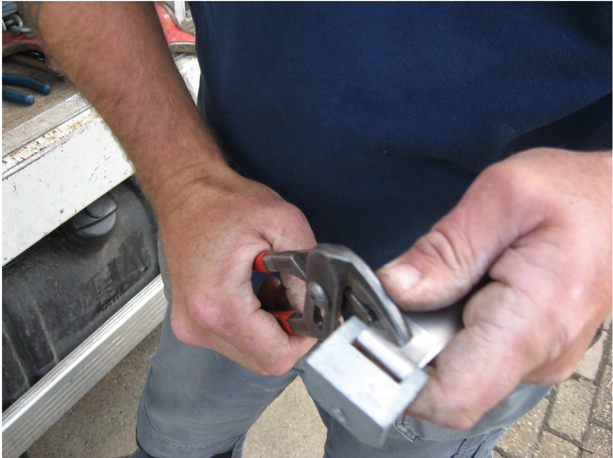
Stap 6 Knijp met de tang de vouw strak om de hoekijzers heen.